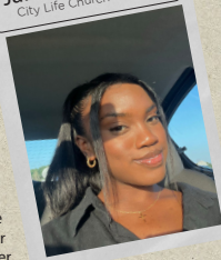
Jannai Montroos City Life Church Tilburg

me ooit had kunnen voorstellen. Hij legde lagen van Zichzelf bloot die ik nooit waardig achtte om te aanschouwen. Maar Hij achtte me waardig, niet door mijn verleden of toekomst, niet door mijn werken of prestaties, maar door de kracht van Zijn bloed. Ik besloot te gaan zitten en naar Hem te luisteren, Zijn liefdesverhaal te lezen dat Hij voor mijn leven heeft. Door Hem vond ik vrijheid, acceptatie en genezing en ik zal Hem voor altijd dankbaar zijn.